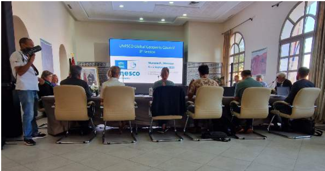
Cruinniú de Chomhairle Geopháirceanna Domhanda UNESCO i Maracó, Meán Fómhair 2023