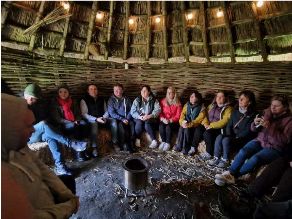
Líonra gnó ag tabhairt cuairt ar yurt cois tine Bluebell Lane le haghaidh taithí cultúrtha oíche, Co. an Dúin

ar fud na gceithre gheopháirce. Buailfidh na comhpháirtithe an chéad uair eile i nGeopháirc Buzău Land sa Rómáin i mí Mheán Fómhair.