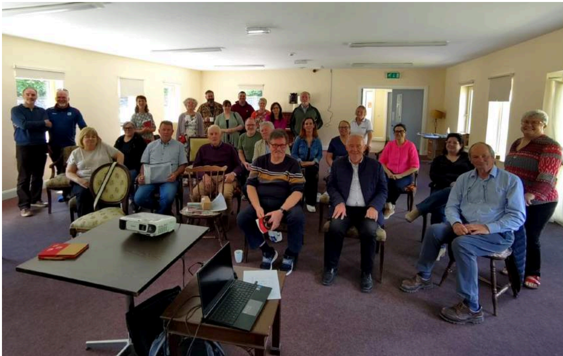
Rannpháirtithe ag Fóram na bPobal na Geopháirce 23 Meitheamh 2024, Ionad Chroisre Chonga

bunúsach eolas a roinnt agus gníomhaíochtaí a chur chun cinn ar mhaithe le comhleas. Chun bheith i do 'bhall líonra' déanaimid measúnú simplí ar an ngnólacht agus ar a chleachtais feadh 20 critéar: tá 3 cinn riachtanach agus tá na 17 gcinn eile forlíontach agus ní mór 12 cheann díobh a chomhlíonadh lena n-áireamh (scór iomlán íosta 15 as 20). Mar sin, táimid ag obair tríd an liostú gnólachtaí anois chun cruinnithe gearra pearsanta a eagrú chun dul tríd na critéir agus chun an bhileog mheasúnaithe a líonadh isteach. Ag glacadh leis go mbaintear pas amach, síníonn an dá pháirtí an comhaontú comhpháirtíochta ansin ar feadh dhá bhliain. Is é an cruinniú an iontráil oifigiúil isteach i líonra Gnó Geopháirce DSLI. Cuirfear plaic bheag, tharraingteach cloiche le taispeáint ar fáil do bhaill de réir mar a fhásann an líonra.