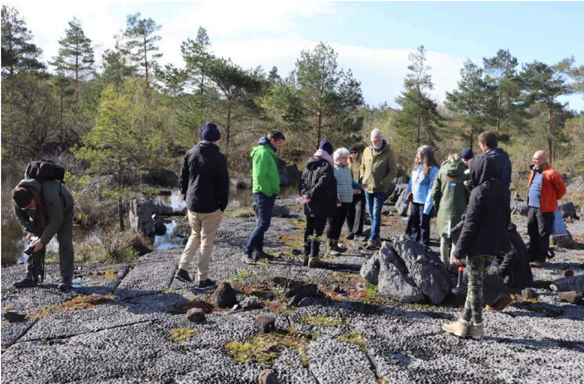
Comhpháirtithe Erasmus+ ag phábhál aolchloiche i gCoill na Fairche, le linn a gcuarite ar Éirinn i mí Aibreáin