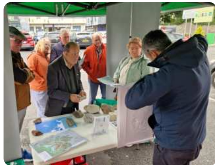
Seó bóthair Geopháirc i dTeach Cúirte Uachtar Ard agus in oifig phoist Bhaile an Róba