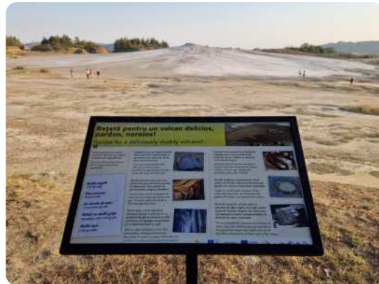
Cruinniú oibre Erasmus+ sa Rómáin